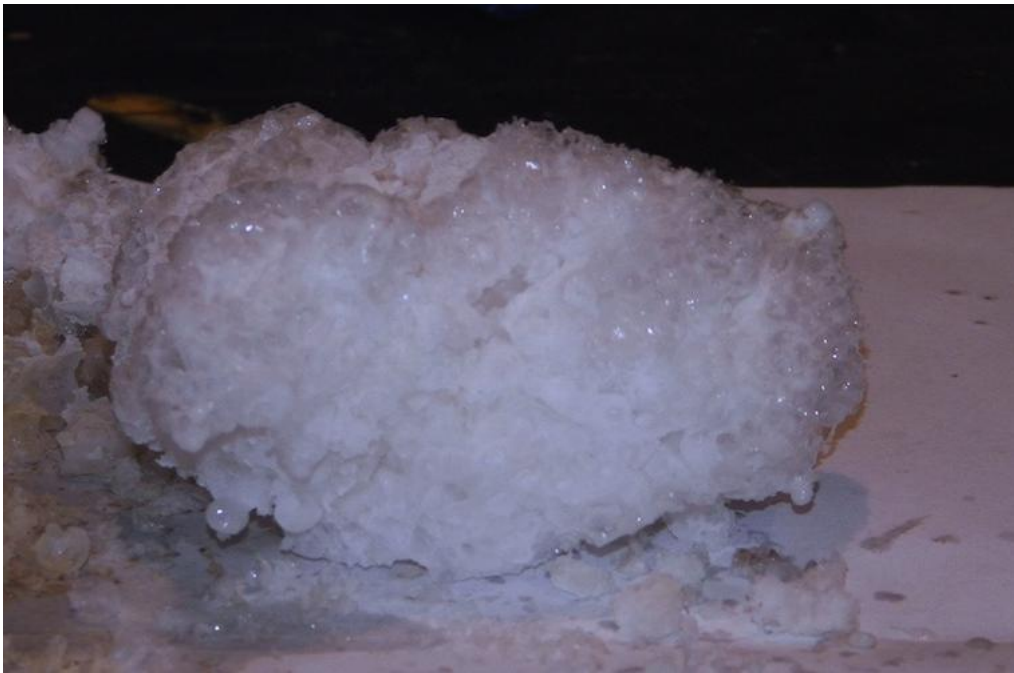
Рисунок 2 – Штучний метаногідрат, отриманий в лабораторії інноваційних технологій ДВНЗ «НГУ»

В процесі досліджень було виявлено декілька способів прискорення процесу гідратування [9, 10]. Для максимально швидкого гідратування та безпосереднього спостереження процесу і своєчасного зняття показників кристалізації, було сконструйовано додаткові модулі. Такий підхід надав можливість глибокого розуміння кінетики гідратування та можливість обробки показників, з метою встановлення закономірностей.